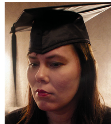
EBS I traditsioonide hulka kuulub kollilõpetajate ameerikalik riietus koos mütsiga

kondlike arengutest. Arenguid on jälgitud läbi sotsiaalse kapitali teooria. Lõputöös on analüüsitud eesti meedia rolli soolise võrdõiguslikkuse teema käsitlemisel ning lugejate suhtumise muutumist viimase paari aasta jooksul ja leitud, et olukord Põhjamaades siis, kui naisõiguslus esimesi samme tegi ja praegu meil, on vägagi erinev ja seetõttu vajab ka teistsugust lähenemist.